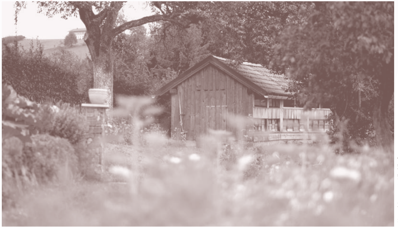
Bienenhütte am Loidholdhof