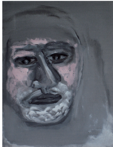
Hannes Weigert: Aus der Serie «Lichtgold» (2009), Bilder für den Loidholdhof, Acryl auf Leinwand, Oberösterreich,